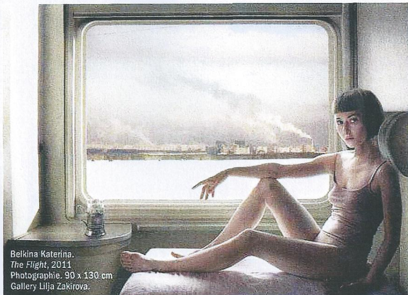
Belkina Katerina. The Flight, 2011 Photographie. 90 x 130 cm Gallery Lilja Zakirova.