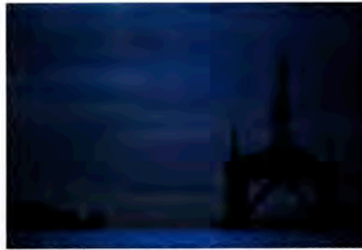
FRANCESCA PIQUERAS, STRUCTURE 498, 2013, ÉCOSSE, TIRAGE ARGENTIQUE.