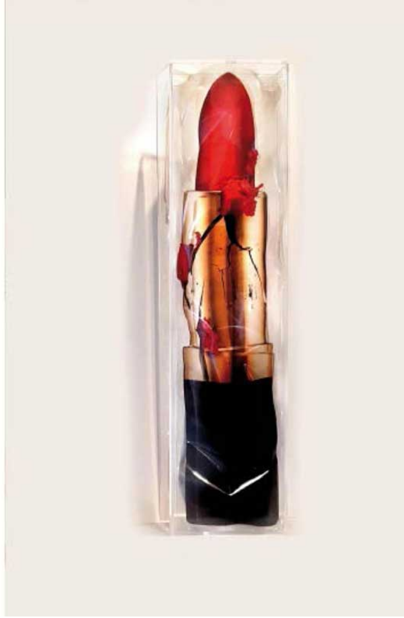
De la serie Ja l'Amor, 2018, Impresión e color sobre capa transparente, encajonado en caja de plástico, 100 x 25 x 10cm - Edición de 8.