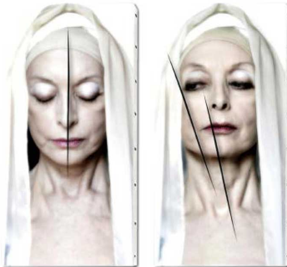
Concerto Faciale, Roma, Chiesa San Siro al Quirinale, 2017, impresión sobre pigmento, tela de algodón de bellas artes, lacrada, 60 x 120 cm. cada una. Edición de 6.

Yves' work is divided into several topics: "Resistance", "Fame", "Passion", "War", "Solitude" and "Erotica" make up the concept map that the artist explores in his work. He uses several supports as means for expression: his paintings, sculptures, photographs and installations carry a message that play on the contrast of beauty, imagination, momentary and the violent and visceral on the other. "I want viewers to ask their own questions and make up