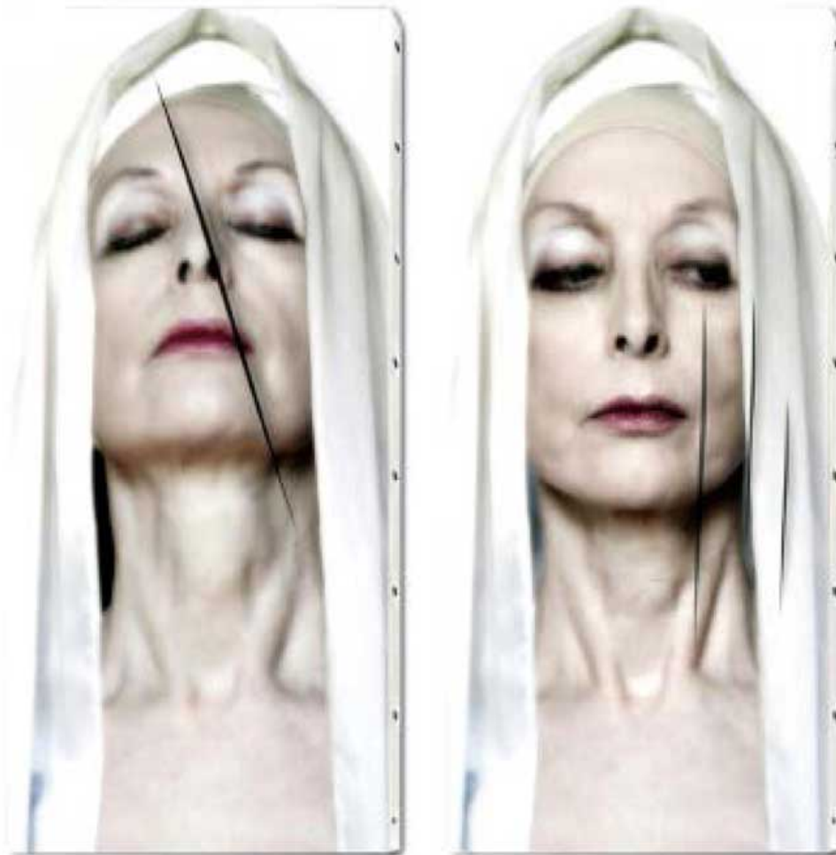
Concerto Facciale , 2016. Impresión sobre pigmento, tela de algodón de bellas artes, lacrada, 60 x 120 cm. cada una. Edición de 6.

What role does the artist have in the face of the imminent manifestation of this abyss? Are they mere cogs in the culture industry machine? Are they destined to create art for financial purposes so they can survive? The answer to these questions lies in the politicization of artwork, not to be confused with "political art": "The Nouvelle Vague iconic filmmaker Jean-Luc Godard said a very important thing "On ne doit pas faire des films politiques, mais faire des films politiquement", which means "You have not to make political films, but to make films politically." In other words, art should not simply adopt a political stance (which is propaganda), but simultaneously question it and let the viewer decide his interpretation," Hoyat assures. He shows us a glimpse of the contradictions of the modern world, though a message that is ultimately decoded by the viewers, who, faced with a new perspective of reality, give freedom a new meaning. AA